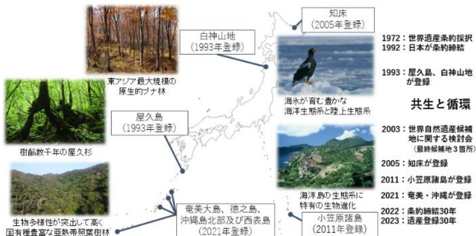
表2 日本の世界自然遺産