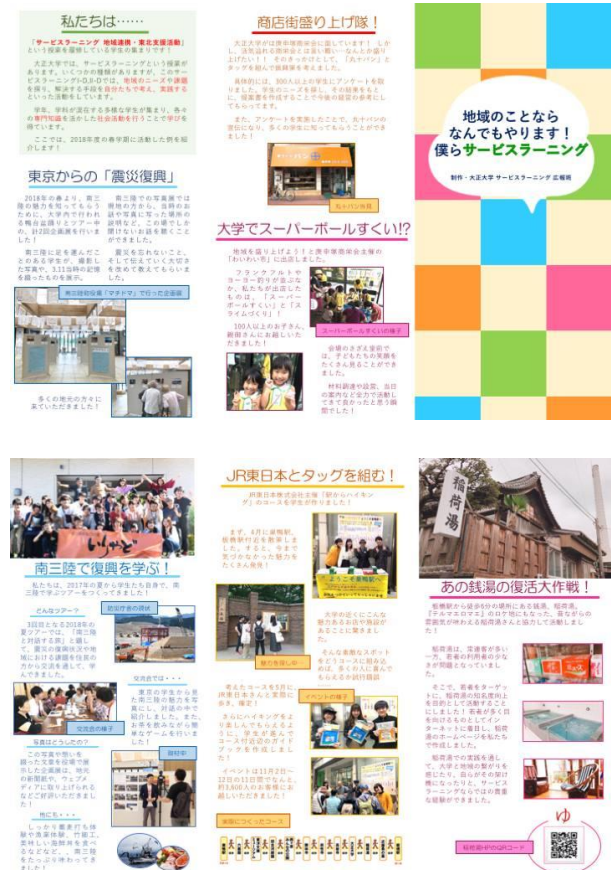
コロナ前に実施していたフィールドワーク例 (2019年制作パンフレット)

新型コロナの対応の検討を図っていた4月下旬、関係者間で協議を重ね、2020年度はオンラインでも可能なフィールドワークを実施していくことが決まった。