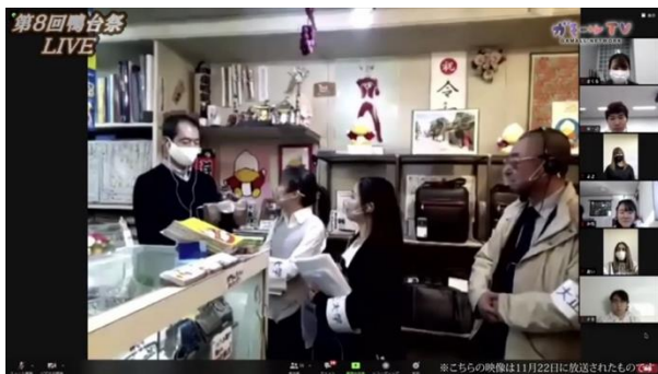
巣鴨オンラインツアーは大学祭で実施

・大正大学の地域活動を広報するメディア「あるきめでいあ（note、Twitter）」の運用（10月-1月） ・各班の活動の撮影（10月-1月）