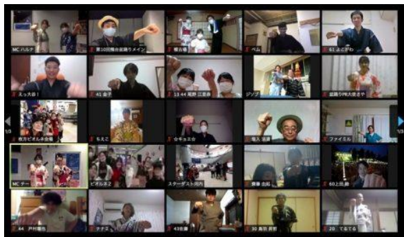
オンライン盆踊りの様子

一方で、大学周辺地域への告知や参加方法の案内が十分にできなかったこともあり、これまで参加者の中心であった地域の方々の参加が少なかったという課題も残った。