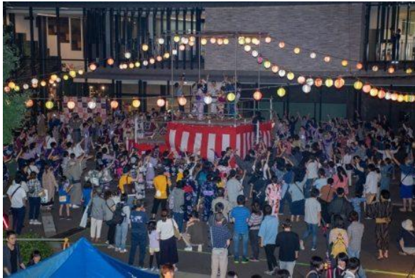
第9回鴨台盆踊りの様子

多くの世代が声をあげながら踊る姿が目立つようになり、盆踊りを通した世代間交流が活発化していた。