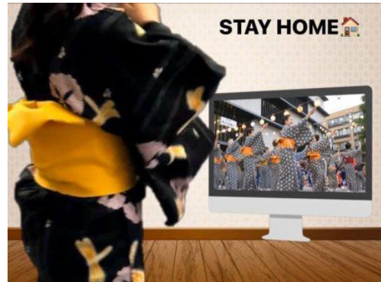
開催決定後 SNS にあげた告知画像（学生制作）

なお、当初よりZoomの使用を想定していたが、企画書では「webをフィールドとした感染の不安がない準備・作業・運営を展開」とのみ記載した（4月24日制作「サービ斯拉ーニング科目の開講に際して」）。